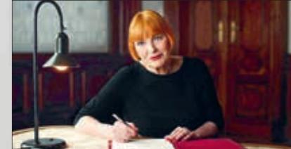
Chris Löhner, TV-Legende & ehrenamtliche Botschafterin, möchte mit ihrem Vermächtnis Gutes tun und bedenkt Jugend Eine Welt in ihrem Testament.

Die Kirchenzeitungen vergrößern Ihre Werbefläche: Sie buchen eine 1/3 Seite & erhalten eine 1/2 Seite im XXL-Format (die maximal bedruckbare Fläche einer halben Seite).